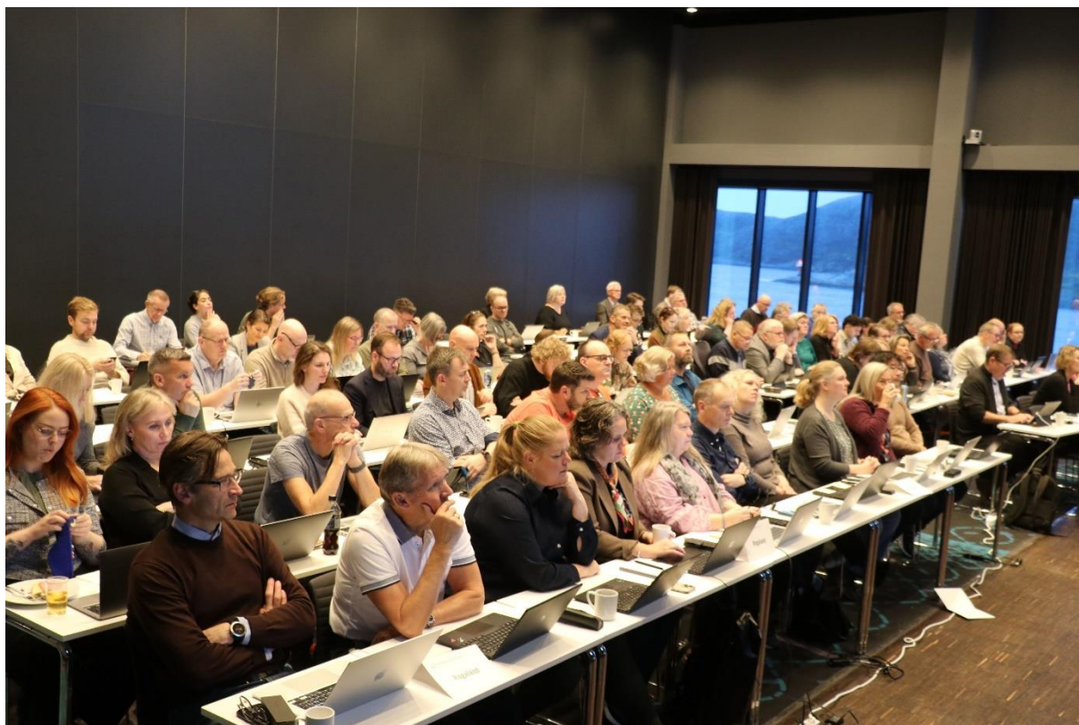
Landstinget i Kulturskolerådet 2024.